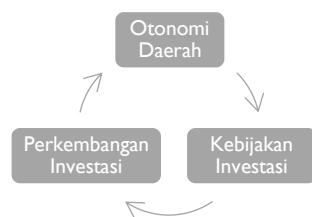
Gambar 2. Korelasi antara Otonomi Daerah, Kebijakan Investasi, Perkembangan Investasi

Efektivitas kebijakan pemerintah daerah dalam meningkatkan investasi dipengaruhi oleh instrumen kebijakan, pelaksanaan, dan pengendalian terhadap pelaksanaan kebijakan tersebut. Instrumen kebijakan untuk meningkatkan investasi berupa: (1)peraturan perundangan dalam kerangka regulasi, (2)pengelolaan belanja daerah dalam kerangka investasi dan layanan publik, antara lain untuk penyediaan layanan terpadu. Mengingat jumlahnya yang mayoritas dan kontribusinya yang besar terhadap perekonomian nasional dan daerah selama ini, maka sangatlah wajar jika fokus perhatian diberikan kepada upaya pemberdayaan usaha mikro, kecil dan menengah dan koperasi, yang dilakukan antara lain dengan pendekatan pengembangan sektor unggulan melalui kluster industri.